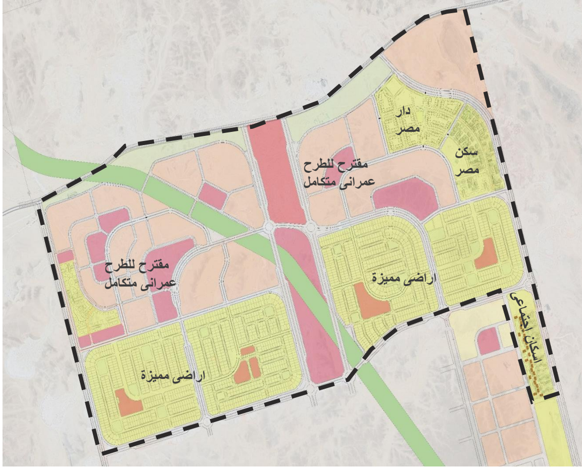
المخطط التفصيلي للمرحلة الأولى

تشتمل المرحلة على مناطق سكنية بمستويات مختلفة ( قطع أراضي عمراني متكامل - أراضي مميزة - دار مصر - سكن مصر - إسكان إجتماعي ) إضافة إلى أنشطة خدمية